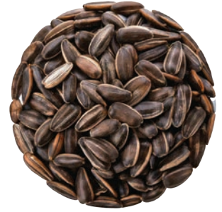
Yerli Çekirdek Turkish Sunflower Seeds