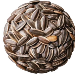
İthal Çekirdek Sunflower Seeds