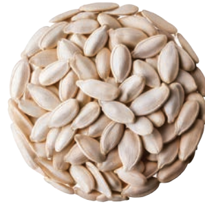
Beyaz Çekirdek White Sunflower Seeds