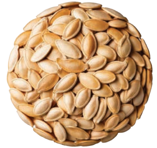
Kabak Çekirdeđi Pumpkin Seeds